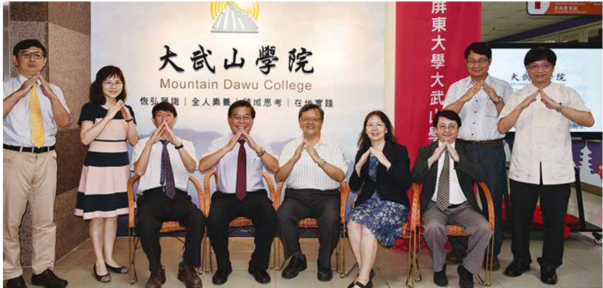
▲屏大擴展通識中心於109學年度成立大武山學院