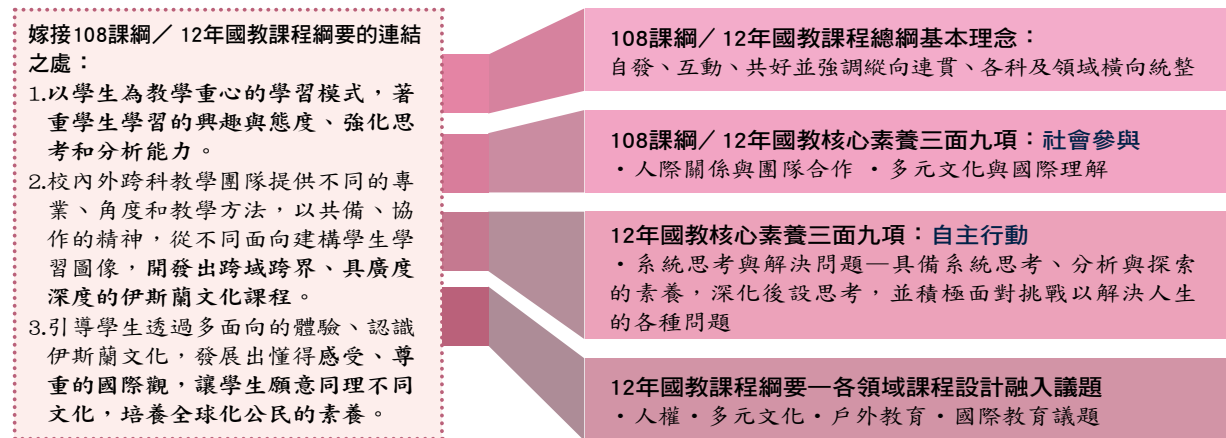
圖四 「Hi！你好 我是穆斯林」課程—嫁接108課綱／12年國教課程綱要

觀點，特別是因應時事或偶發事件，採分組學習單方式融入適當的單元中教學，議題教育也更能有效達成。如在「教義習俗」主題時，課堂上便連結這兩年臺北火車站因辦理穆斯林開齋節而產生的爭議新聞：「『臺北車站被外勞攻陷』—四萬移工湧入北車引起旅客不滿」。讓學生透過分組學習單反思臺灣民眾對於穆斯林的大型活動的評論，經由討論、分享對爭議加以耙梳釐析。