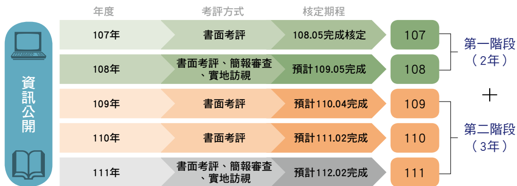
圖二 高教深耕計畫考評機制