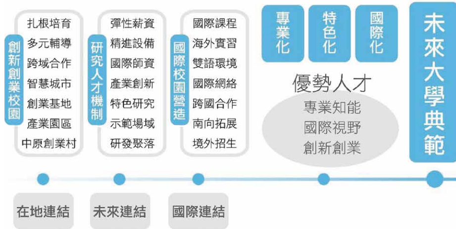
圖三 中原大學發展學校特色策略

創新人才的培育。在深厚學術研究基礎及產學能量，推動創新研發和強化創新創業生態，並連結國際、在地企業，培育本校人才競爭力，建構本校成為知識型創新創業特色大學。本計畫以「產業」及「人才」為重點，致力於創新創業人才培育、強化海外連結、發展本校創新場域，成功整合大桃園創業資源予校內師生，並輔導衍生新創企業，成功整合大桃園創業資源予校內師生，並輔導衍生新創企業。