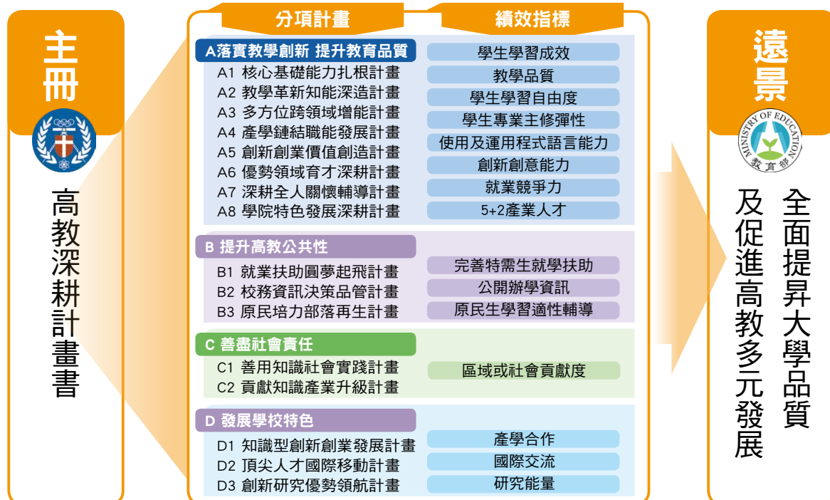
圖一 中原大學109-111年度高教深耕計畫十六項計畫

中原大學在規劃高等教育深耕計畫（以下稱高教深耕計畫）之時，面對國際高教少子化，以及以學生為本的治理重心，回歸教育本質，做好本位治理與校務研究工作。為落實本校全人教育理念，在綜整分析各項學生學習成效、教師教學精進及畢業生回饋等資料，參酌部訂高教深耕計畫