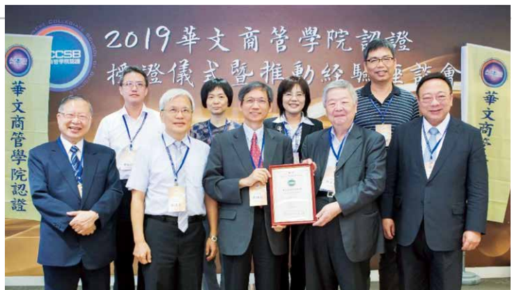
▲崑山科大獲頒品保系統（QACPB）認定證書。

本院成立於民國94年，目前設有企業管理系暨碩士班、資訊管理系暨碩士班、房地產開發與管理系暨碩士班、國際商務與金融碩士班、全球商務與行銷系、金融管理系等5個系4個碩士班。學院以「培育具備品德倫理；團隊合作；溝通協調與管理專業之商業人才。」作為教育目標；並以「培育學生成為優質商業管理之專業人才；協助教師成為前瞻商業管理知識之專業顧問；建構學院成為組織經營與產業發展之教育及研發重鎮」作為發展願景。並以「專業管理能力、團隊合作能力、溝通協調能力、倫理與社會責任、自我承