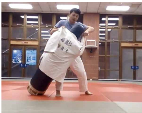
▲線上柔道課請來「柔道綠豆」作為演練對手。

專責導師室），分別輔導1,567人以及16,460人次學生，更透過電話或線上多次進行學生疫情關懷輔導及預防宣導，針對學生不同需求，提供身心健康諮詢、學習輔導的專業服務。此外，亦規劃各項學生經濟安心措施（提供慰問、生活助學等），照顧所有受疫情影響的同學，同時確保所有學生在學校安心就學、平等、不受歧視的基本權利。