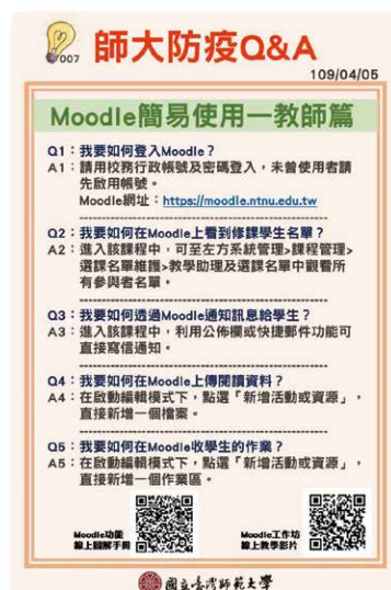
▲防疫專區、防疫快訊、防疫Q&A。