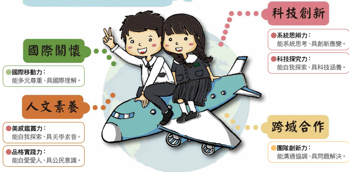
圖一 慈大附中學生圖像

歌所呈現的，在K到12的學園中，希望營造出充滿大愛、關懷、感恩、健康、快樂、希望的學校風氣，然而，如此形而上的目標，是否符應時代潮流，而能培育出迎接未來挑戰的人才呢？