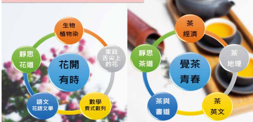
圖三 慈大附中校訂必修「人文美學」系列課程架構圖

茶韻花香的校訂系列課程，不僅孕育出兩組跨領域的教師社群，由導師、專任老師與外聘專家共同攜手開發，實施一年之後，此校訂課程獲高中優質化計畫評為亮點課程，同時，也發現校園的空間、人與人之間的氛圍有些微的變化，是什麼變化呢？答案應該是，老師與學生都可以感受到更多人文藝術的美感吧！