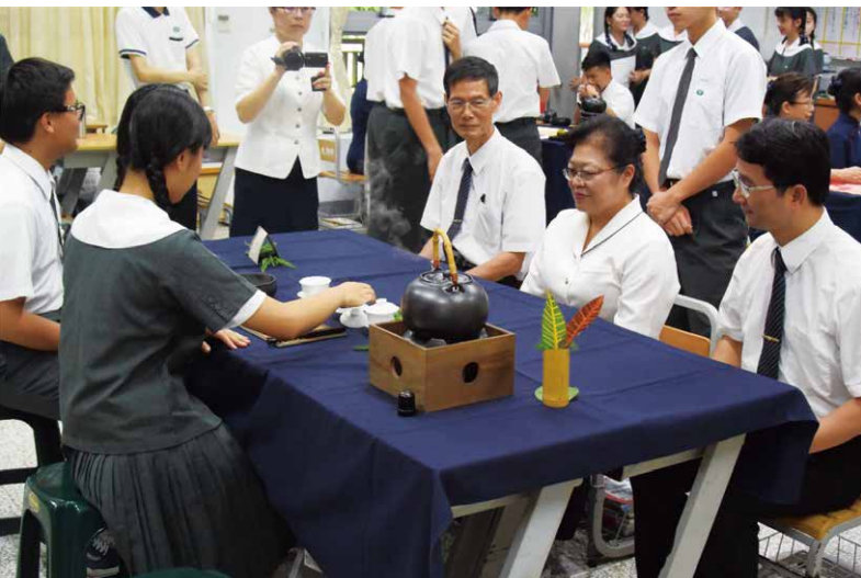
▲慈大附中校訂必修「覺茶青春」期末成果發表。

師，要讓學生尊重老師，必須先培養學生對老師的感恩心，同樣的，老師對學生也應該有真摯的愛，才能展現師生之間的禮儀。