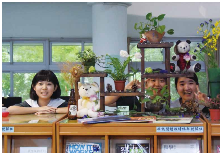
▲慈大中校訂必修「花開有時」期末成果發表—融入情境的花語布置。

縣長)三村申吾先生，在連任後的第一次縣務會議中宣布，將於7月率領各局處首長飛來臺灣，親自到後山的花蓮尋找答案，他的疑問是：是什麼樣的學校可以培育出既有國際視野又有不凡氣質的學生？同年7月，三村縣知事一行九人在慈大附中找到答案。