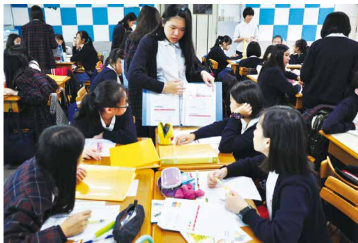
▲高中學生向國中學生示範說明自己的領導力筆記本。

事本、生涯檔案紀錄本，如今又需要一本自我領導力筆記本，似乎疊床架屋，導師看到學生總無法好好完整有序的進行紀錄，於是由教師燈塔團隊開始腦力激盪，於今年度將既有的生活手冊融入領導力筆記本的元素，再加上聖心師生的領導力之星故事，徵選學生的封面設計，我們推出了全新的「聖心領導力生活手冊」，希望提供學生一本實用的手冊記錄個人每學期的生活與學習，並於家長會時拿出手冊向自己的家長分享個人如何設立目標、運用執行策略與執行工具完成自己的夢想。當家長看見自己的孩子可以充分說出自己的想法與執行方式，成功或失敗的反思，家長的思維也從看結果轉化為看過程，無形中學生與家長都以成長型思維來看自己的學習。