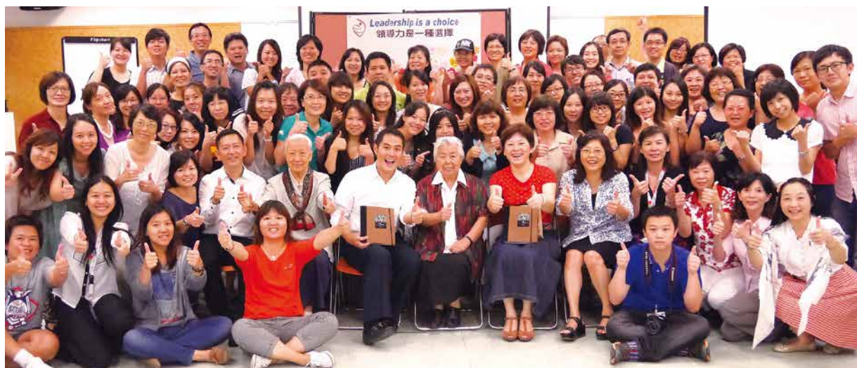
▲聖心女中打造自我領導力學校。(聖心女中提供)

命，活出高效能的生活，並具體實踐在教學以及行政工作中，企圖以成人的身教為先，讓更多學生進而從成人的典範中學習並活出七個習慣，成為一位由內而外皆優質的人才。