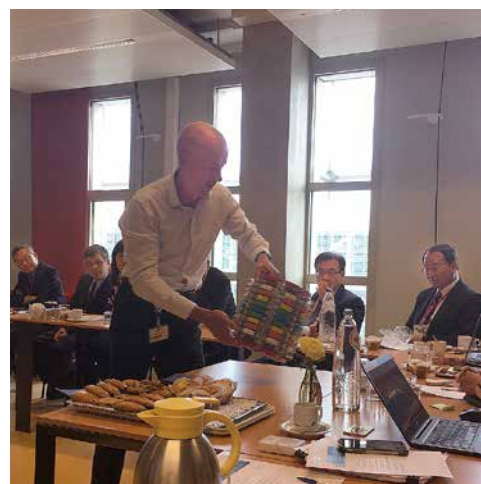
▲萊頓大學 (Leiden University) 參訪。

學、國立臺灣大學、國立臺灣師範大學、亞洲大學、臺北市立大學、康寧大學、臺北醫學大學、國立虎尾科技大學、國立臺北科技大學、國立臺灣科技大學之校長、副校長、正副研發長與正副國際長等人加入本次海外攬才的行列，堅定表達為臺灣求才留才的決心，也提供學者們與面對面的交流機會。