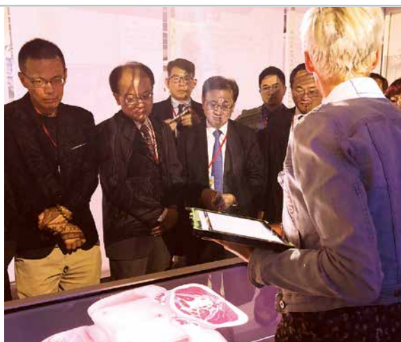
▲於荷語魯汶大學參訪電子解剖台。

本次海外攬才陣容堅強，其中比利時與荷蘭部分包含臺灣9所頂尖大學，分別為國立中山大學、臺北醫學大學、國立交通大學、國立清華大學、國立成功大學、國立中興大學、國立臺北科技大學、國立中央大學、國立臺灣科技大學；英國部分17所，分別為國立中山大學、國立中正大學、國立中央大學、國立中興大學、國立交通大學、國立成功大學、國立東華大學、國立清華大