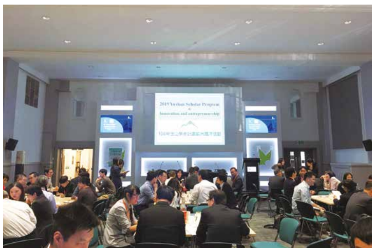
▲英國倫敦場攬才於英國倫敦大學學院。