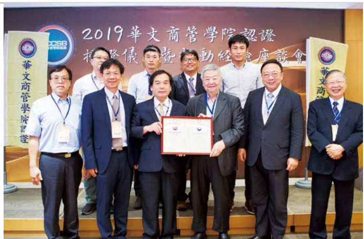
▲2019年ACCSB授證儀式暨推動經驗座談會。

技職校院是培育社會科技人文菁英的搖籃，也是提升國家實力的基石。面對21世紀多元多變的知識經濟時代，強化人力實務技術素養，提升國