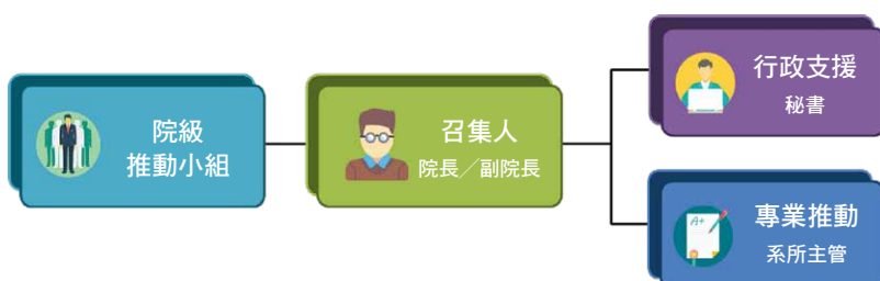
圖二 院級推動小組組織架構