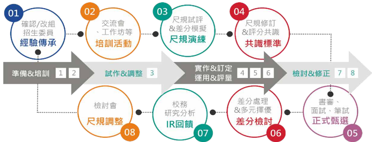
圖四 招生專業化工作迴圈

召開「差分處理會議」。本校推動小組開發了「資料審查輔助系統」，並鼓勵審查委員於個人申請入學第二階段運用該系統以提升審查的效率。