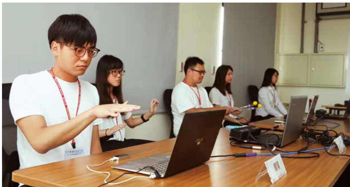
▲強化多元學習，讓學生找到自己的未來。

主肯認之相同能力。所以整個教育流程也是高度的規格化，例如教材，僅有一綱一本，最多是一綱多本，絕對沒有多綱或是非綱。