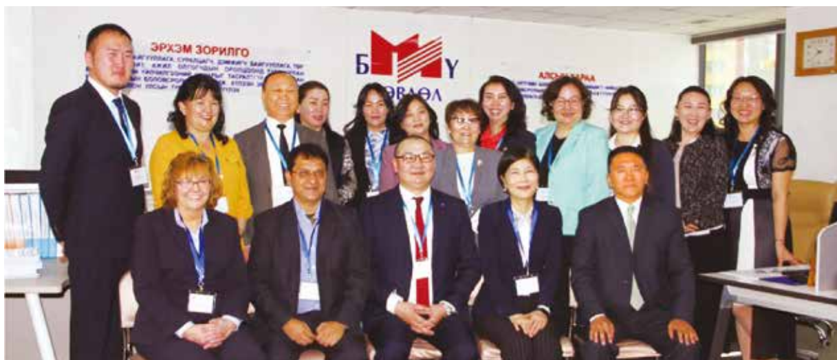
▲訪評小組成員與MNCEA合影。

部決策人員、MNCEA董事會成員、訪評委員、大學品保單位人員等對話，以了解MNCEA的運作現況及未來可能發展。另外，訪評小組也參訪 National University of Mongolia與Mandakh University 兩所公私立大學，實地了解MNCEA評鑑對大學的助益及影響。訪評小組在檢視每一指標的表現，綜合考量之後，建議MNCEA的訪視結果為「實質符合」（Sustainably Compliance with APQR），並獲得APQR委員會通過。