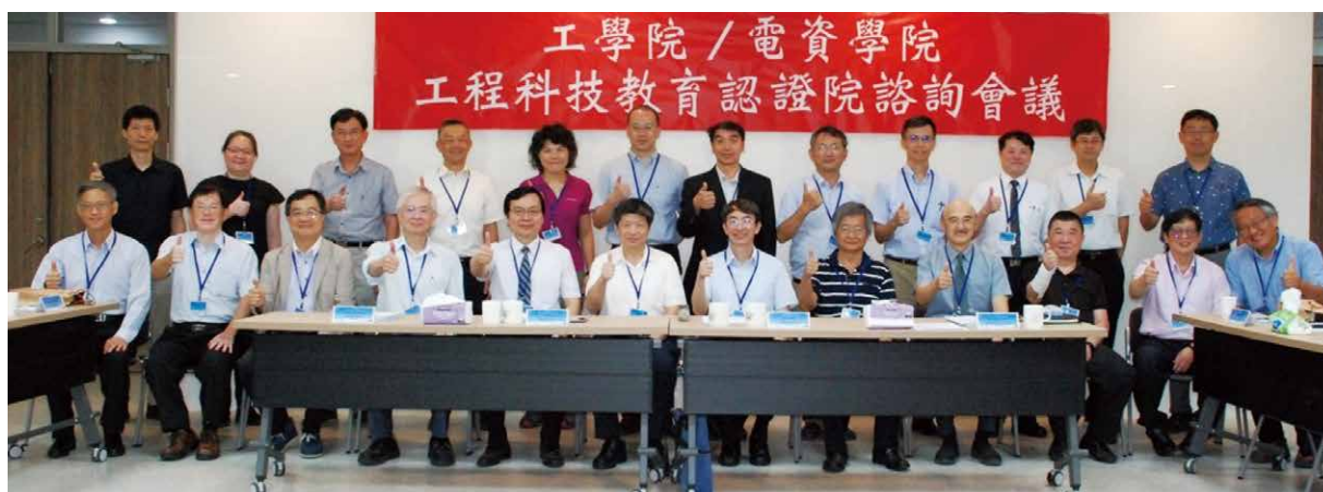
▲工程科技教育認證院諮詢會議。