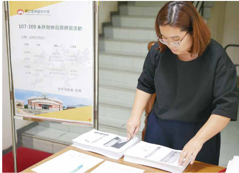
▲校內舉辦系所品保相關研習活動。

編製「實地訪視作業手冊」，以利委員掌握系所評鑑時間、地點、流程與任務等，並將校內舉辦相關研習課程資料置於網頁，方便委員不受時空限制地瀏覽參閱。另一方面，因為訪視委員來自北、中、南各地，不易安排於同一時間、地點參與研習，乃配合全校16個受評系所分三梯次辦理實地訪評之際，於實地訪視前一日邀請委員提前蒞校參與評鑑知能研習，會中講述評鑑倫理的重要性，並特別就評鑑時應兼顧受評系所之資料機密性、受訪者之人權保護、評鑑訪視過程之專業行為，以及結果判斷之偏見與曲解樣態等予以重申。