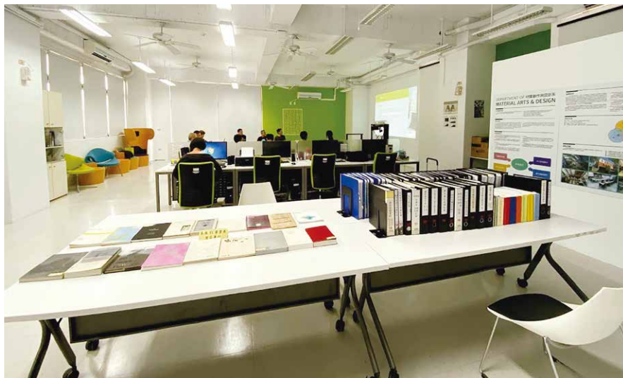
◀▲材質創作與設計系實地訪視會場。

果，從而調整課程、師資之安排，以及規劃未來發展方向，精益求精；同時透過高教評鑑中心的認可機制，達到強化系所辦學品質與提升國際能見度之目的。