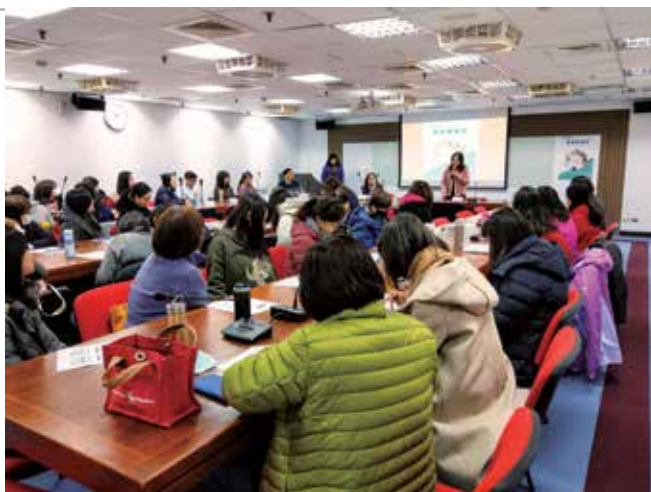
▲校務研究人員應多參與相關議題的工作坊與研討會，提升專業知能。

校務研究最重要的基地是「資料庫」，必須緊密結合各業務單位的資源，彙整數據並加以分