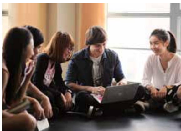
▲高教評鑑未來需更重視學生的就業力表現。

文章資料來源為1980-2014家庭收支調查。根據行政院主計總處說明，家庭收支調查對象為臺灣具中華民國國籍之個人及其所組成的家庭，採分層二段隨機抽樣方法，以縣市為副母體，再