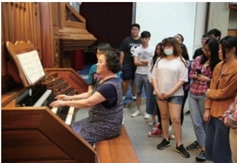
▲大學評鑑有助增進系所辦學品質，鼓勵師生共同建立品質保證文化。

為了落實大學自主，引導各 為大學建立完善自辦外部評鑑機制，在完成第一週期系所評鑑與校務評鑑的基礎下，教育部於2012年7月17日訂頒「教育部試辦認定大學校院自我評鑑結果審查作業原則」，符合申請資格之大學，其自辦外部評鑑機制及結果經教育部認定者，可申請免接受同類型評鑑，希望藉此將品質保證與持續改善的思維內化於大學組織文化中。