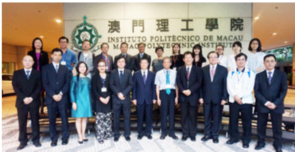
◀▼澳門理工學院多個學士學位課程已通過高等教育評鑑中心評鑑，成為澳門通過臺灣學術評鑑首例。

試委員，邀請在相關學科／專業具一定國際影響力的資深專家學者擔任，與課程考試小組一同審核考評項目及相關評分的合適性。校外考試委員還會就課程整體的考評工作提供專業的外部意見，以保證課程所授予之學位與國際標準一致、學生獲得的知識和能力與學歷相吻合。