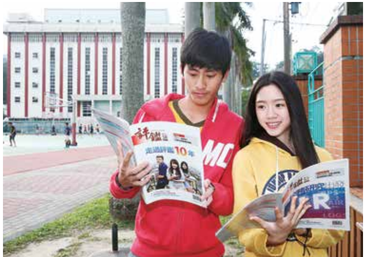
▲第二週期系所評鑑通過率高於第一週期，顯示臺灣高教品質已逐漸提高。

95年下半年至96年上半年，高教評鑑中心共給出604個認可結果，其中包含440個通過、131個有條件通過、33個未通過，而後改以不同學位班別的班制給予認可結果，共給出2,220個認可結果，其中包含2,013個通過、200個待觀察、7個未通過（如表一）。在完成整個第一週期系所評鑑後，高教評鑑中心共給出2,824個認可結果，其中包含2,453個通過、331個有條件通過、40個未通過。