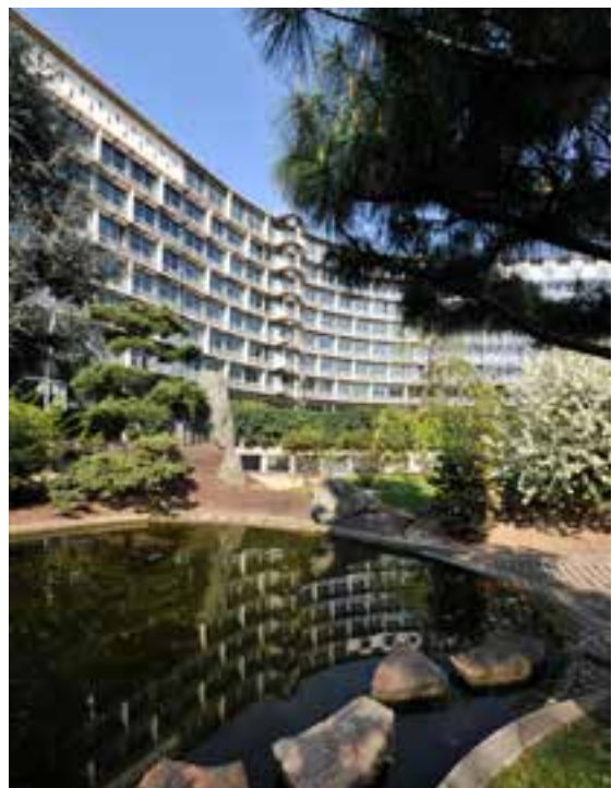
▲聯合國教科文組織（UNESCO）巴黎總部。

國教科文組織／經濟合作暨發展組織（UNESCO/OECD）已於2005年公布第一份跨境教育品質準則：「跨國高等教育品質準則」（Guidelines for Quality Provision in Cross Border Higher Education），並針對三個主要機構——政府、大學與評鑑機構，提醒其在跨國高等教育品質發展該擔負的責任，以及彼此須相互合作的急迫性。而此一準則也是目前最廣為世界各國作為確保跨