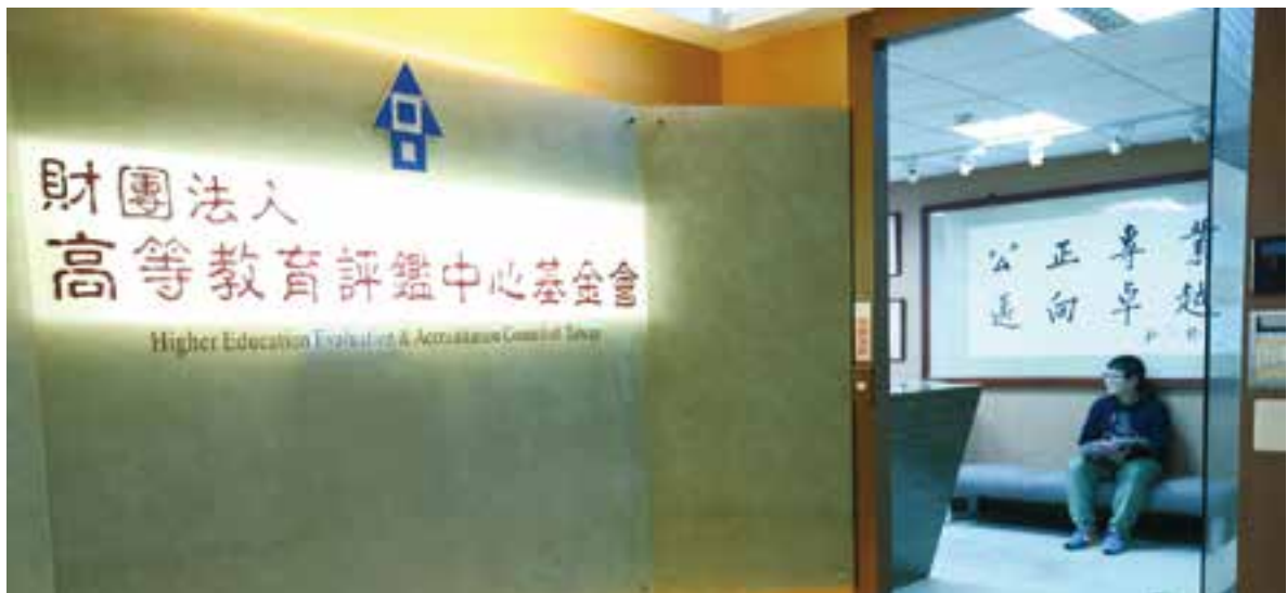
▲臺灣的高教品保機構應扮演跨境教育品質的守門員角色。