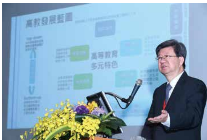
▲教育部吳思華部長發表專題演講。

吳部長強調，評鑑中心成立已屆十年，系所評鑑制度由外部評鑑逐步走向自我評鑑，評鑑指標亦由繁化簡、由單一走向多元，讓大學有更多呈現辦學特色的空間，而評鑑中心的任務也將從專責評鑑擴展到其他領域。他期勉未來十年，評鑑中心能成為國家一級品保機構，協助我國開展