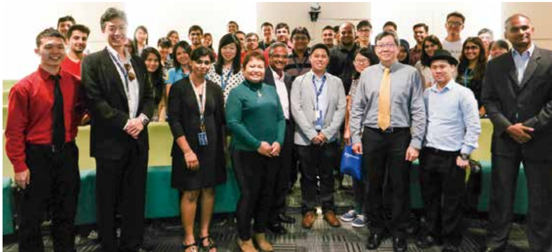
▲蒙納許大學馬來西亞分校學生參加學校舉辦的就業活動。