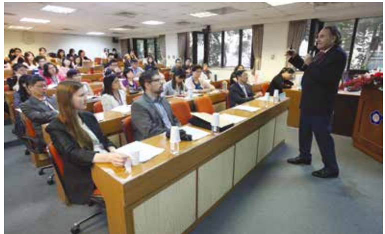
▲品保機構舉辦國際會議是提升評鑑專業知能的重要方式之一。

歸納近十餘年來有關臺灣的大學評鑑制度之進展項目，包括政府逐步調整評鑑作為、成立評鑑專責單位、建立雙層模式品質保證制度、授權評鑑專業機構進行評鑑、鼓勵大學建構內部品質保證制度、輔導國內人文社會學會建立評鑑專長、鼓勵評鑑專業機構參與國際性組織等。