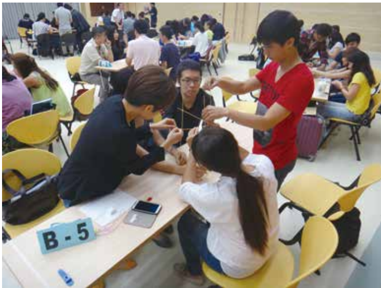
▲輔仁大學管理學院是全國第一個通過AACSB認證的大學。

AACSB評鑑標準、協助學校進行自我評估 (self-assessment)、提出各項問題使學院進一步釐清其辦學計畫與成果，最重要的是協助學院撰寫「自我評鑑報告初稿」(Initial Self Evaluation Report, 簡稱iSER)。