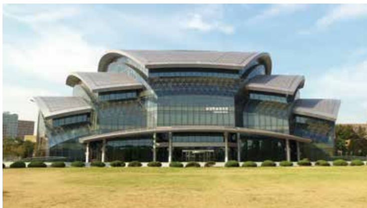
▲韓國成均館大學一景。

學科，有以下三項例外，如宗教、藝體能與新設、轉換（專門大學轉一般大學、產業大學轉一般大學）編制完成後，於2015年尚未滿二年者。其他欲要求除外者，須經大學結構改革委員會審議。