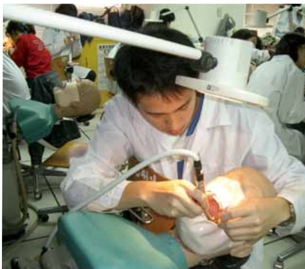
▲中山醫學大學教學實驗課程。

有了認同感和評鑑知能，參與評鑑工作的人員就要明確分工，相互合作。以校務評鑑為例，依評鑑五大項目成立工作小組，依照每項目內涵及最佳實務，推選適當的項目統籌負責人及執行秘書，負責召開各組討論會議、資料彙整、進行簡報、審查及撰寫自評報告書。每項目下依效標