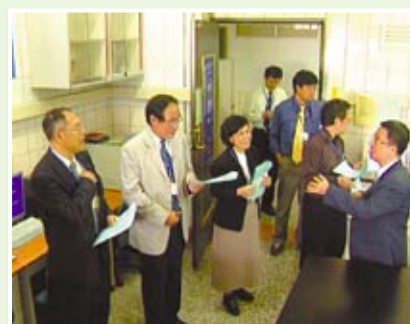
▲評鑑委員訪視中山醫學大學。