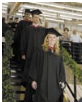
► 哈佛大學校長波克(Derek Bok)在1987年6月的畢業典禮中，強調學生應在老師輔導下，進行跨國學習。