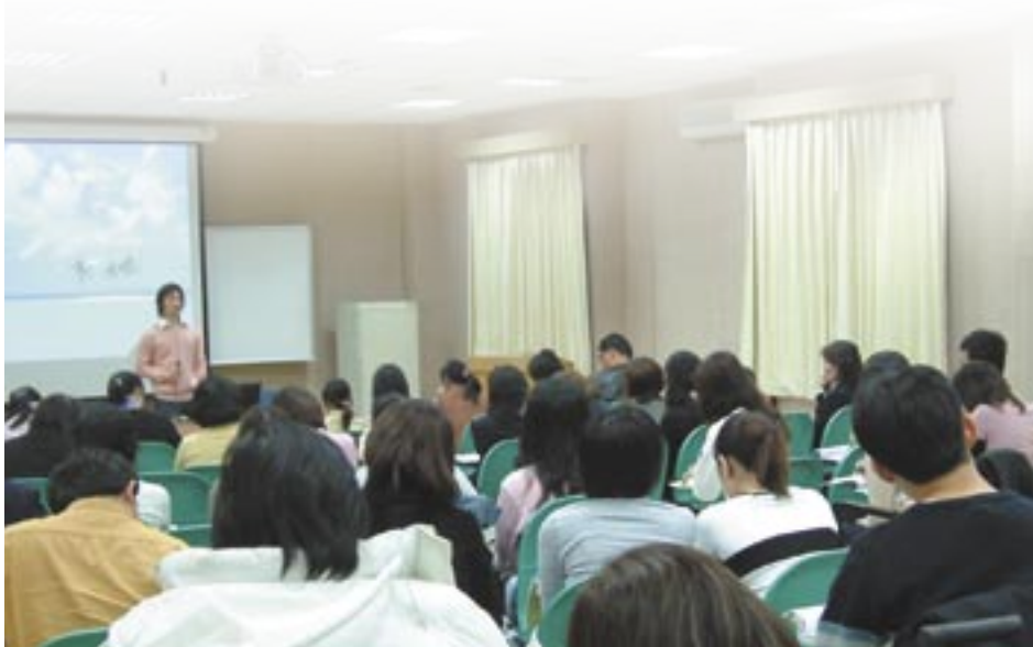
◀教學品質的提升讓師生互惠，學習成效倍增。