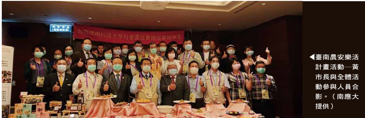
◀臺南農安樂活計畫活動—黃市長與全體活動參與人員合影。

同試辦期2個計畫，也均獲通過。3個計畫均為關懷被忽略的臺南在地文化，整合校內跨領域團隊，共同解決在地問題。