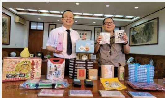
▲志在琉鄉——全島啟動USR萌芽型計畫合照留影。