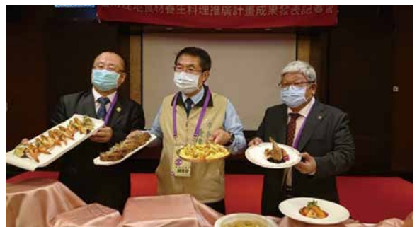
▲臺南農安樂活計畫活動—本校黃董事長、黃校長與黃偉哲市長合照。（南應大提供）

台南應用科技大學（簡稱南應大）是一所非常獨特的文創教學型大學，期許為「創意的搖籃、人文的殿堂」，延續創校以來在生活服務、文創設計、藝術人文、觀光休閒、商業管理等領域，培養「文化創意產業」的人才為目標。臺南素以悠久的文化與農業著稱，因此本校的發展也圍繞人文生活、休閒旅遊產業相關之餐飲、烘焙、旅館管理、運動休閒、空間與環境設計、文創商品設計、視覺設計，以及周邊的流行時尚、服飾設計、行銷管理等相關產業發展。與其他科技大學最大不同之處，在於本校擁有全國技職體系唯一的藝術學院，包含：音樂系、美術系、舞蹈系、流行音樂學士學位學程，藝術氣息得天獨厚。對於社會與人文的關懷，更是本校各系所的教學與服務重點，同時校內也有許多長期參與社區經營與地方產業特色增值服務的教師；在校務發展計畫書中，實際執行策略已包含「社會實踐」相關主題，每年致力於在地社區與產業連結，多年來已有豐碩成果。本校為更落實「大學社會責任」，校務發展計畫書主軸架構表已將實踐大學社會責任明確規劃於校務發展計畫作為發展特色。