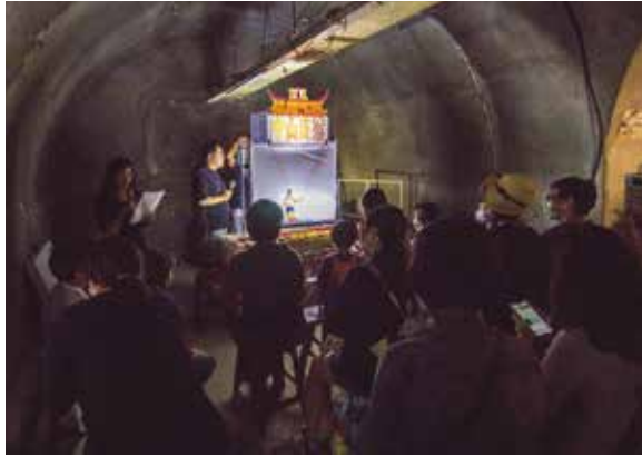
▲皮影戲專案—奇幻光影秀。