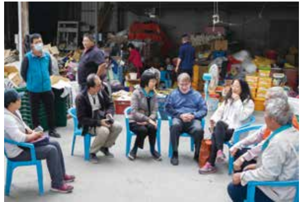
▲推動南方修理聯盟－在地的農村國際修理論壇交流。

為了讓計畫團隊能夠開疆闢土、培育人才，產出豐富的教學成果和積累實踐產出，本校挹注25%配合款、每年200萬元。此外，因應多個教育部、科技部實踐型計畫之行政需求，本校成立校內一級單位「社會實踐與發展研究中心（簡稱