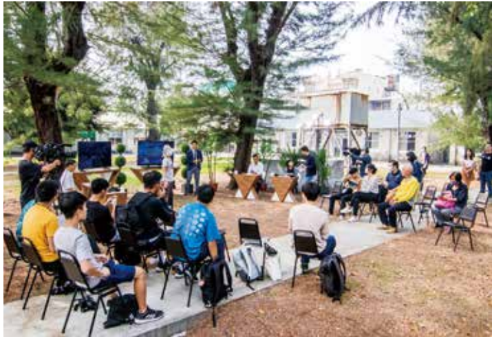
▲學生參與農漁廢調查社區討論—錄製村民大會。

踐的課程研發與教學，而團隊亦協助教師升等、評鑑行政工作，並與之討論專案課程和場域結合，同時進行科技部等計畫發展、期刊論文之發表。另外，透過助理成員和場域夥伴建立工作群組，強化跨域合作串聯，擔任場域經營關鍵人員，投入空間維護及資源整合，進行多方對話與協調，落實場域經營之溝通管道。