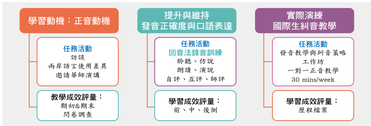
圖一 研究問題、任務活動與成效評量對應圖