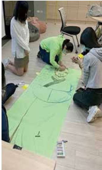
▲學生於課堂繪製孔子弟子身體地圖。