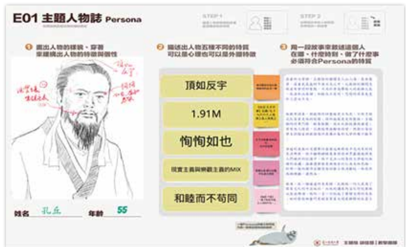
▲主題人物誌。

然笑曰：「形狀未也，如喪家狗，然哉！然哉！」時，其心理的影響是正面還是負面的？這樣的外顯行為所表現的獲得與挫折，其實是我們在同理一個對象時很好的切入點。