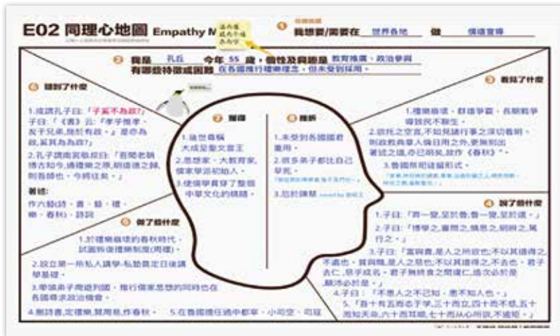
▲同理心地圖。

中談的是「朋友切切悒悒，兄弟怡怡」，正因為朋友可以選擇，所以應該是要相互砥礪，即便可能分開都沒關係；但兄弟卻是不能割棄的天擇，所以應當「怡怡」，並牽涉了家庭倫常的問題。這部分的主題討論是透過繪製朋友的心智圖進行，並在完成討論後再進行修正，確認哪些人屬於朋友、哪些人不是。即是透過不同的單元中校正學生人際倫常的合宜性。但我也要需要強調的是，因為其歷史語境，《論語》並不是一定是正確的。