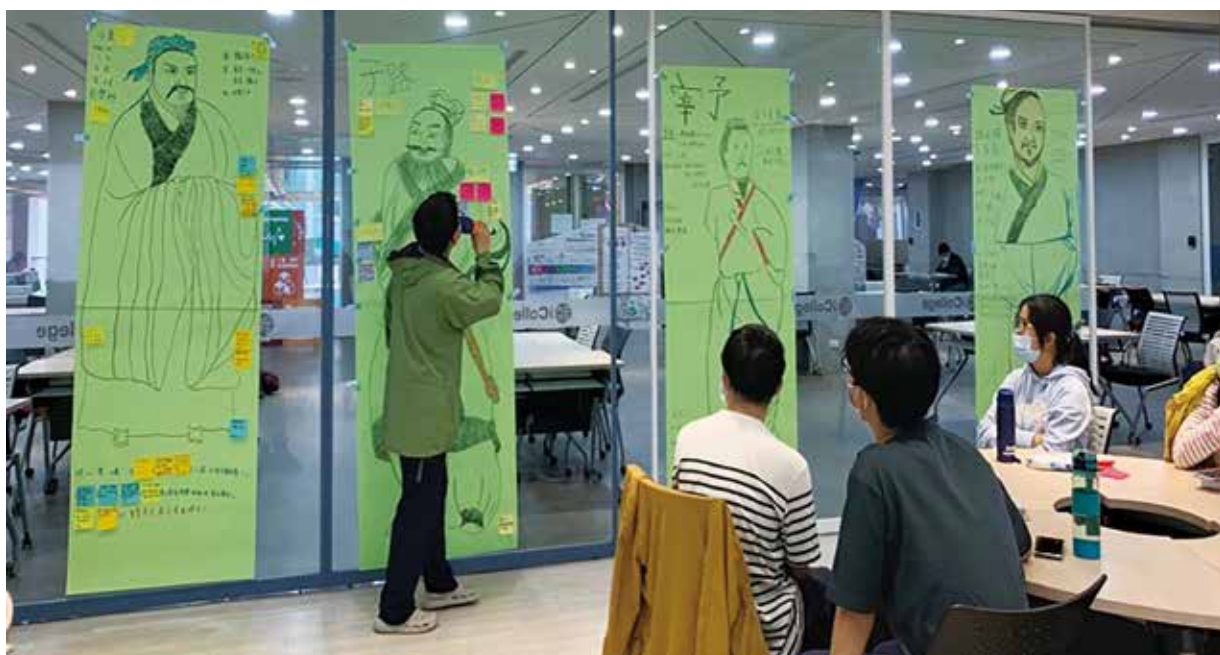
▲孔子弟子身體地圖。