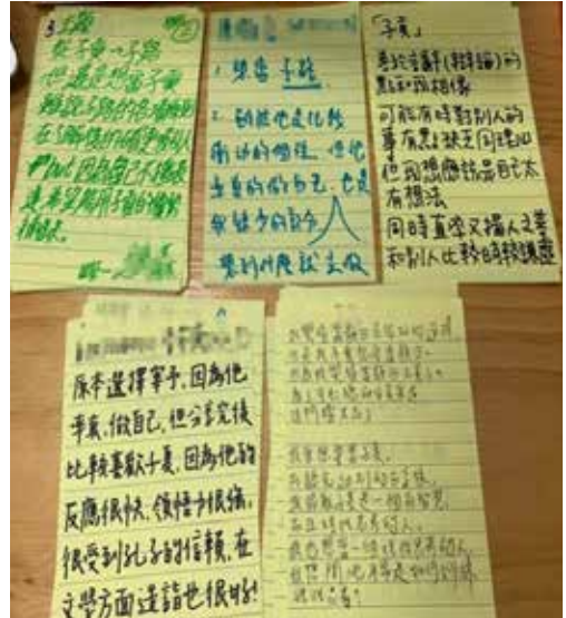
▲孔子弟子身體地圖反思。

容，根本沒有辦法共同合作帶領學生。因此，我認為不管是研究端或教學端都很需要合作的彈性和包容。