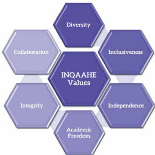
▲INQA AHE Values。(取自INQA AHE官網)