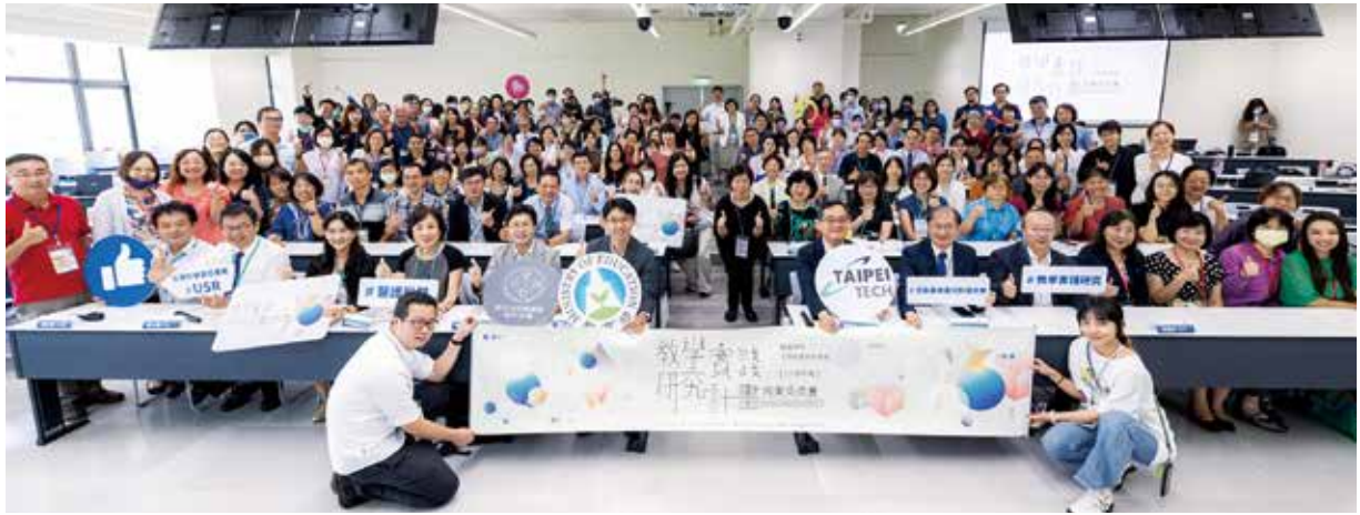
▲商業及管理學門與數學學門場次開幕式合影。

隨著計畫的推動，教育部堅定的立場不變且愈發重視，計畫的規模逐漸從「點的培養（計畫主持人）」，連成「線的跨校支持（區域基地）」，繪製成「面的整體發展（高教領域教學品質提升）」。從歷年申請與通過計畫的累積，也看出各大專校院、教師對本計畫的支持與肯定：6年來總計申請件數超過19,000件、累積計畫成果逾6,500件、拔擢亮點及績優計畫461件，補助經費逐年提升至新臺幣4.5億元。