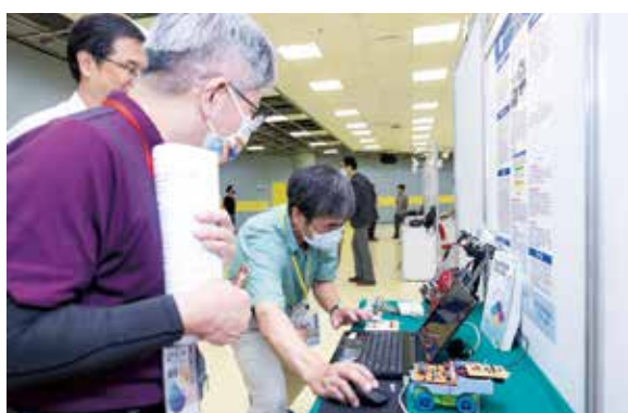
▲技術實作專案成品展示。