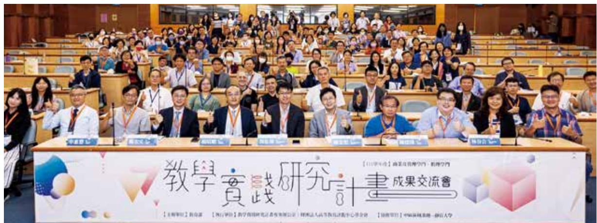
▲醫護學門與USR專案場次開幕式合影。

教學實踐研究計畫自107年度起推動，期待透過補助個別教師的方式，從教學現場中發現問題，藉由改善課程設計、導入教材教法、運用教具科技媒體等方式提升教學品質，同時鼓勵教師具備研究以外專長，多元開拓教師的職涯發展。