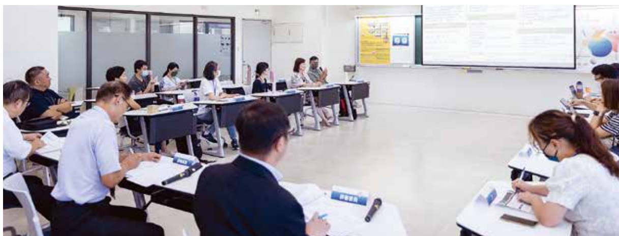
▲USR專案多年期計畫圓桌論壇。