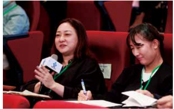
▲高教評鑑中心「2023國際研討會」活動現場——現場與會者問答。

for Higher Education Evaluation) 亦分享，雖然日本的大學沒有學生會，但在評鑑的實地訪視過程中有晤談學生的環節，大學一般也透過學生問卷來得到學生的意見。日本的品保機構在評鑑指標中載明學校須回應學生的意見及需求，特別是關於學習支持、心理及生理健康、學習環境、學習資源的部分。許多大學學生雖然會參與校內與學生事務相關的事宜，或經由社團辦理學生活動等，但囿於法規限制，日本的大學生並不參與校務會議或校內委員會。