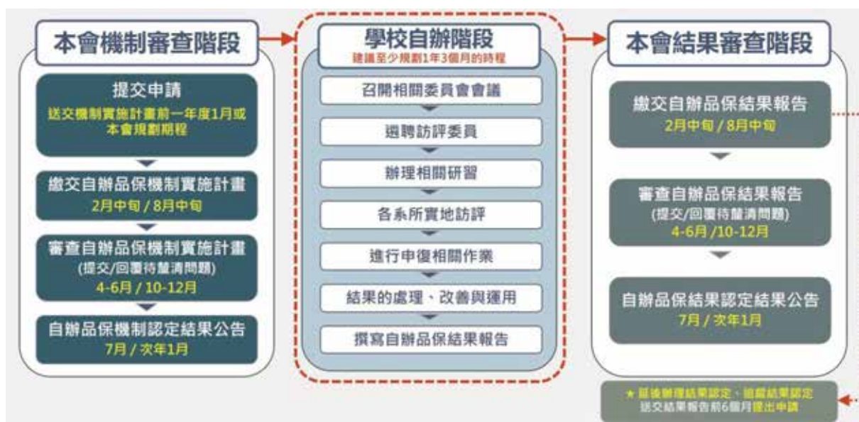
圖三 新週期自辦品保作業期程